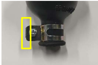
現行品: 金属製バンド